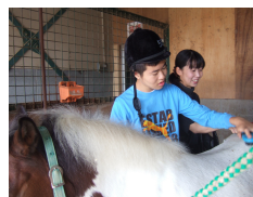
たくさん毛が抜けました