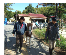
馬を引いて帰りました