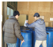
そうじも頑張りました