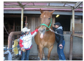
“あっかんべ〜?” (グレイス)