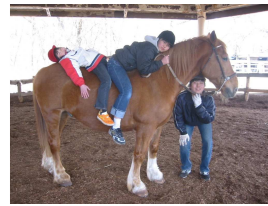
「シーザーはあったかいよ！」