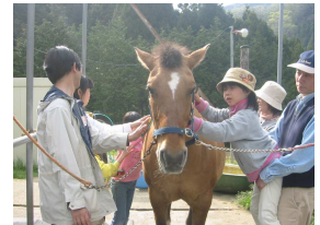
乗せてくれてありがとう