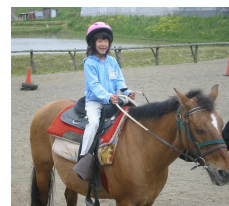
「たづなを引いたら止まったよ」