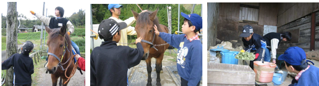
輪なげに挑戦! 「このあと、乗せてね」 協力してエサ作り