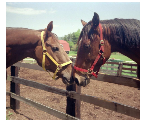
馬同士のあいさつ