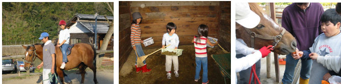
鞍を付けずに乗ってみました みんなで協力 「早く食べたいよ」(ベガ)