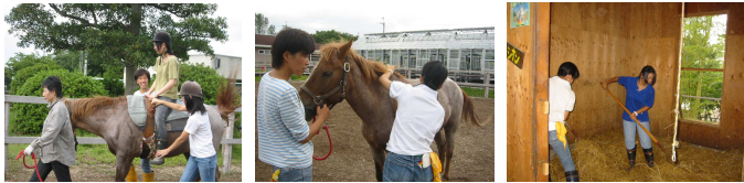
補助の仕方体験 ブラシがけで馬と仲良く もちろん馬小屋掃除も