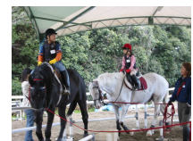
待ちに待った乗馬です