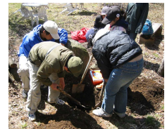
タイムカプセルを埋めました