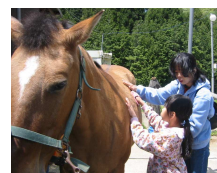
毛がたくさん抜けて大変でした